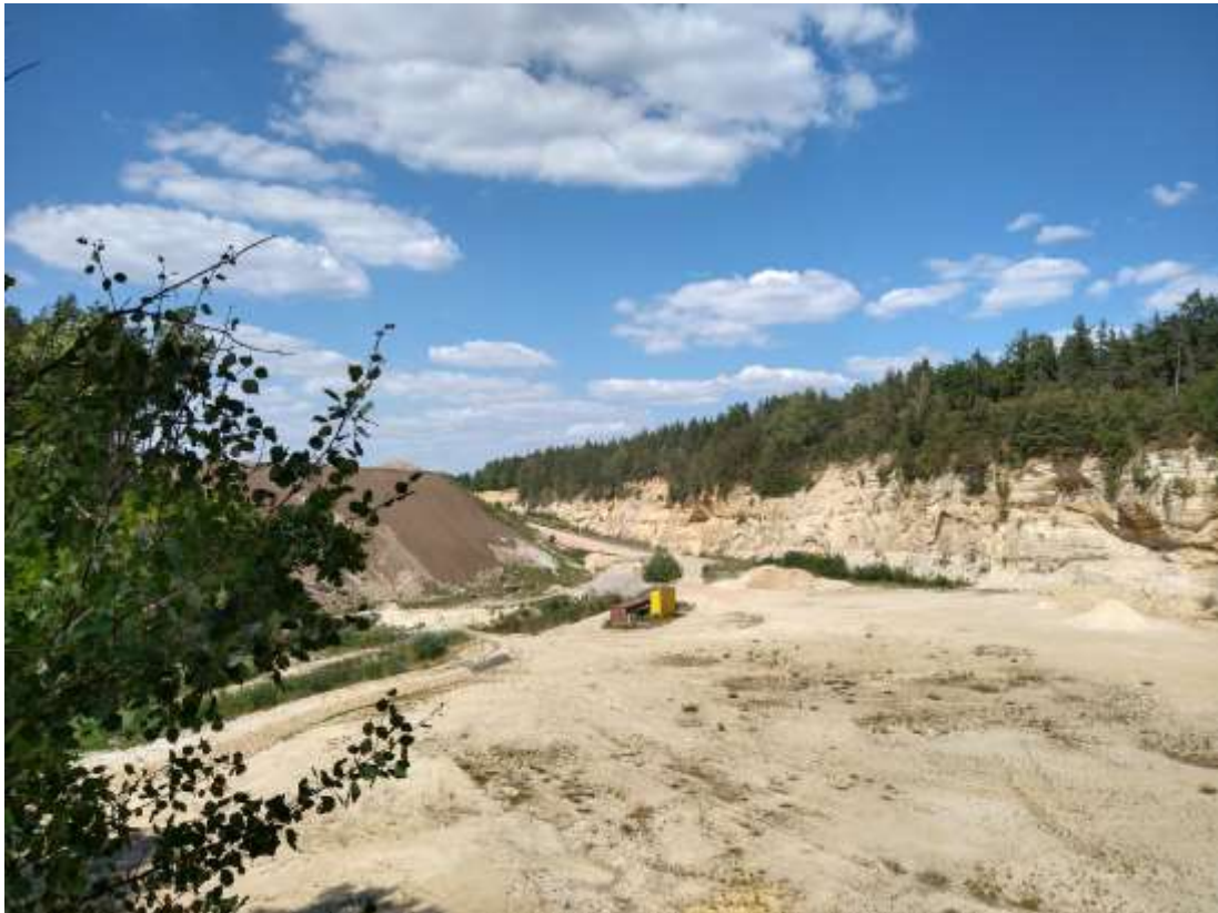
Abbildung 3: Blick auf den südlichen Bereich der Sandgrube Bocksrück mit wechselfeuchten Mulden im Vordergrund und Nadelholzmischwald an der Abbruchkante nach Osten hin (Blickrichtung Nordost, Bild: OPUS 2022)