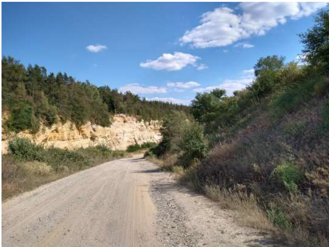
Abbildung 4: Initiales Gebüsch und trockene Säume auf den ungenutzten Bereichen der bestehenden Abbaufäche