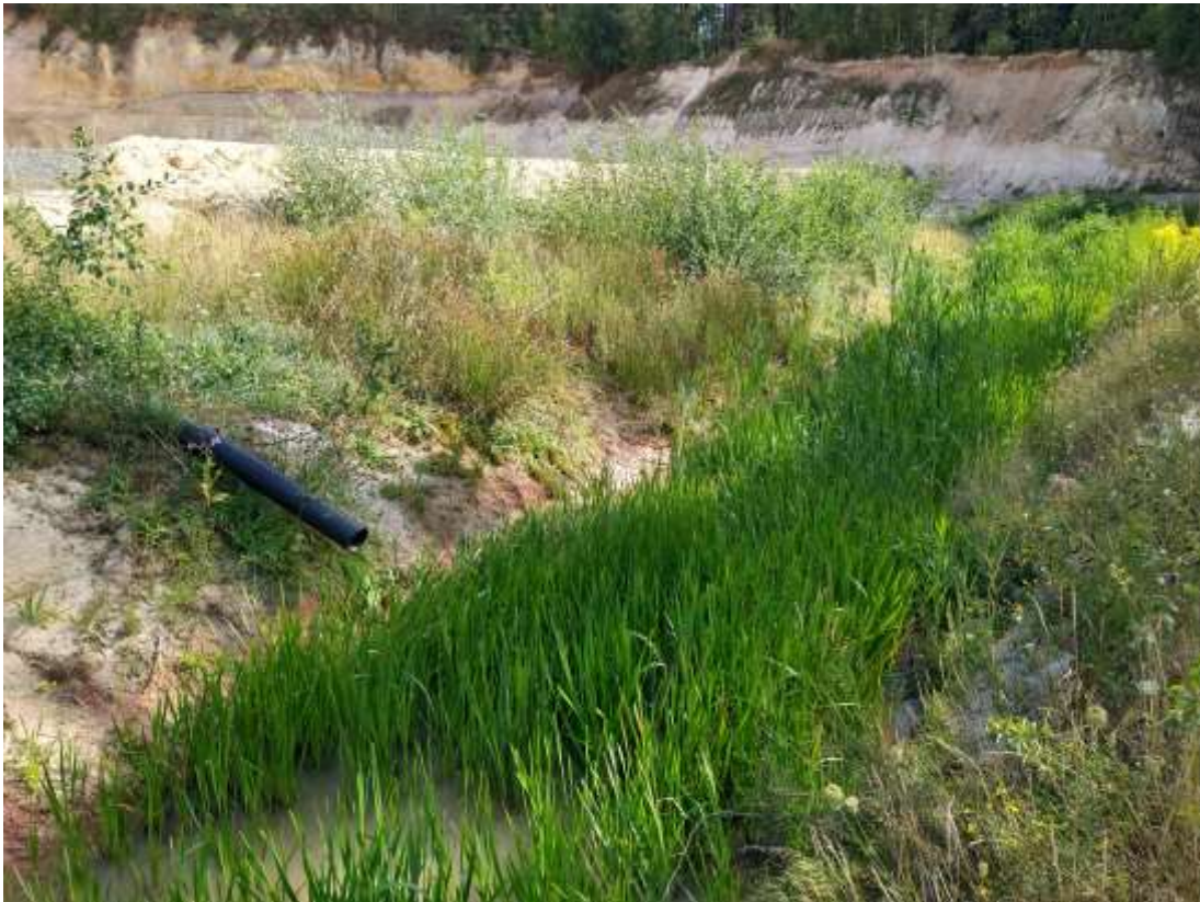
Abbildung 5: Regenrückhaltebecken mit Röhricht im südlichen Bereich der Sandgrube