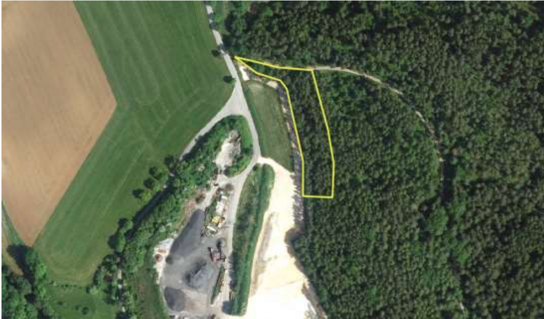
Abbildung 6: Bereich, in dem die Wurzelstöcke der gerodeten Gehölze erst in der Aktivitätsphase der Zauneidechse (Mitte April bis Ende August) entfernt werden dürfen (Karte genordet; Grundlage: Geobasisdaten © Bayerische Vermessungsverwaltung 2021, bearb. OPUS)

> Entfernung nur zwischen Mitte April und Ende August